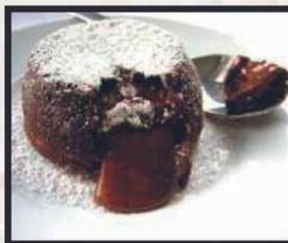
CUORE CALDO* € 5,00