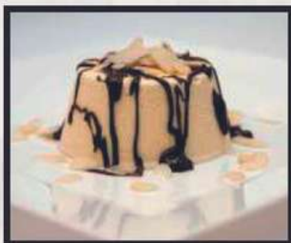
PARFAIT DI MANDORLA * € 5,00