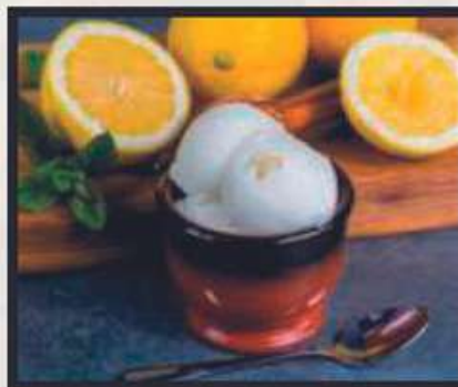
SORBETTO AL LIMONE* € 3,00