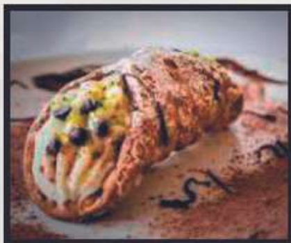
CANNOLO DI RICOTTA € 3,00